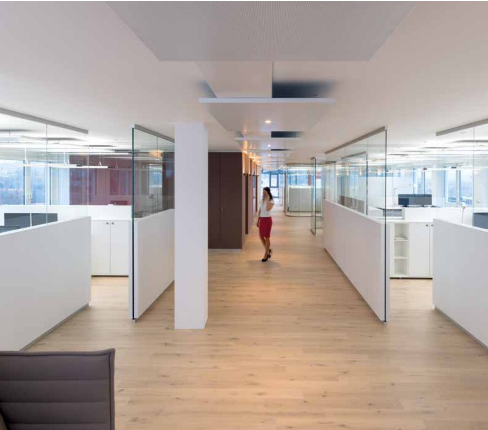
Glasakustikwand System 7400

Das System 7400 ist eine Kombination von raumhohen Glaselementen mit hochabsorbierenden Vorwand- und Deckenabsorbieren. Damit lassen sich akustisch voneinander getrennte Arbeitsbereiche schaffen sowie auf die jeweilige Tätigkeit abgestimmte Nachhallzeiten erzeugen. Die Transparenz des Großraums bleibt durch die horizontale Anordnung der Absorberflächen und den Verzicht auf Türen erhalten.